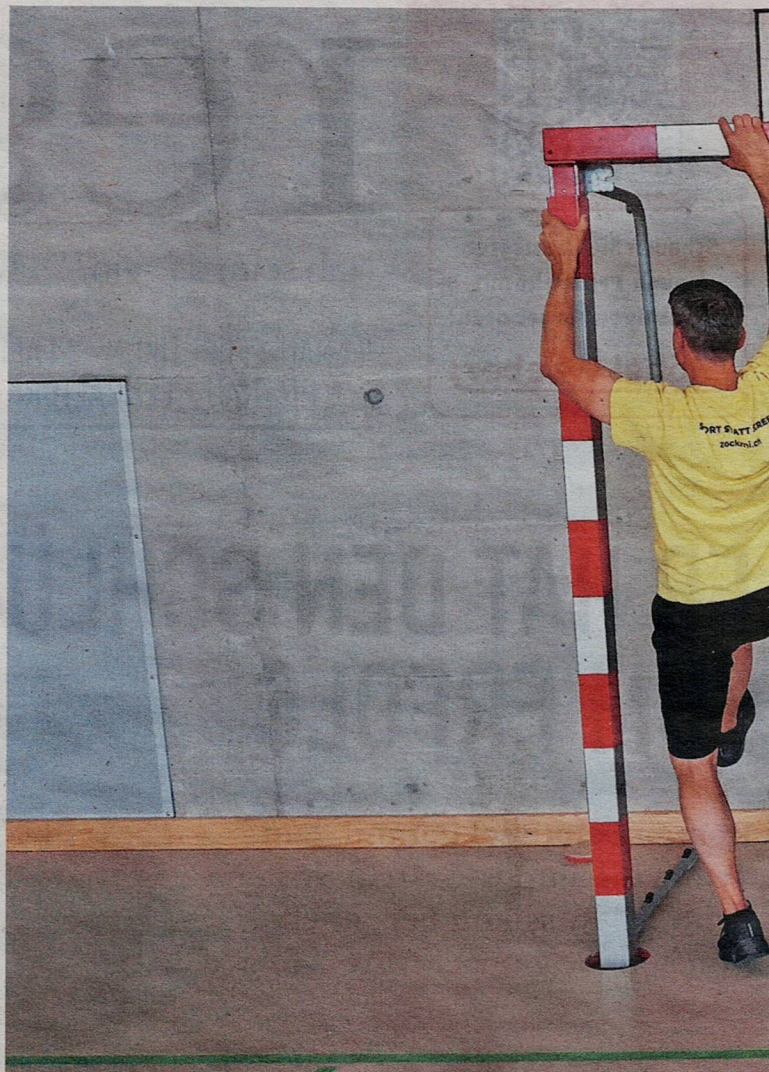
Gespielt wird auch in der Turnhalle.